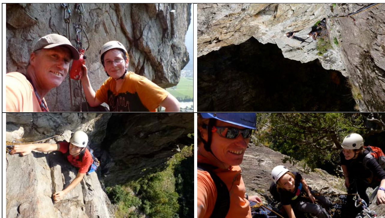
Programmbeschreibung Kletterlager La Dôle 4/4+

Nicht Imbegriffen : Anfahrtskosten zum Lager und Rücktransport.